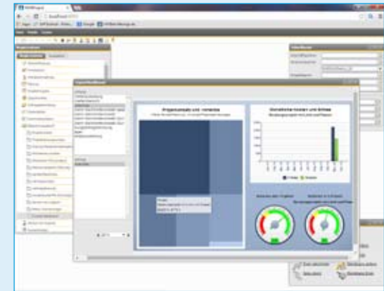
Viele aktuelle Projektauswertungen erhalten Sie auch unterwegs.

In MARIPROJECT sind alle Daten miteinander vernetzt. Nur deshalb lassen sich differenzierte Auswertungen auf Knopfdruck erstellen. Damit Sie jederzeit wissen, wo Ihre Projekte stehen!